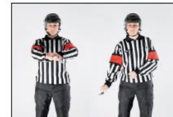
Holde motspillers kølle