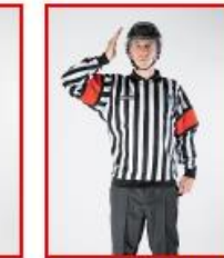
Takling mot hode og nakke