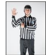
For mange spillere på isen

Bilder markert med rød ramme er Policyutvisninger og gjelder opp til og med U15 Dette er regulert i Kampreglementet §2-9, totalt 9 forseelser