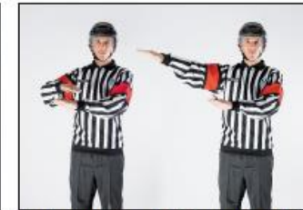
Pucken over vantet / Forsinke spillet