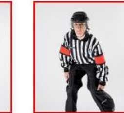
Farlig lav takling - Clipping