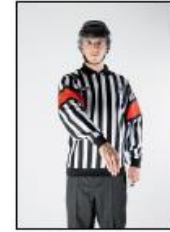
Offside i målgården