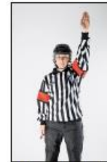
Avventende / Bytte