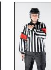
Ulovlig kroppstakling (Kun kvinner / jenter)