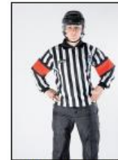
Dårlig oppførsel / Usportslig opptreden