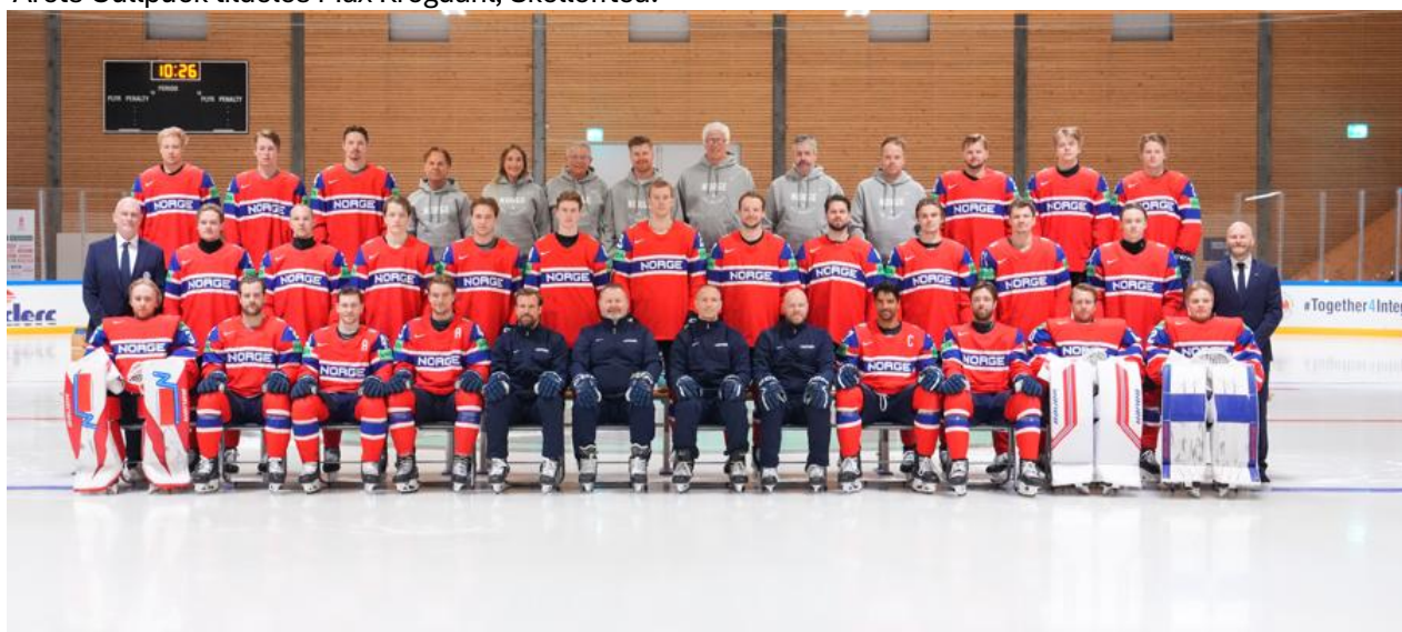
Lagbilde VM 2026.

Årets Gullpuck tildeles Max Krogdahl, Skellefteå.