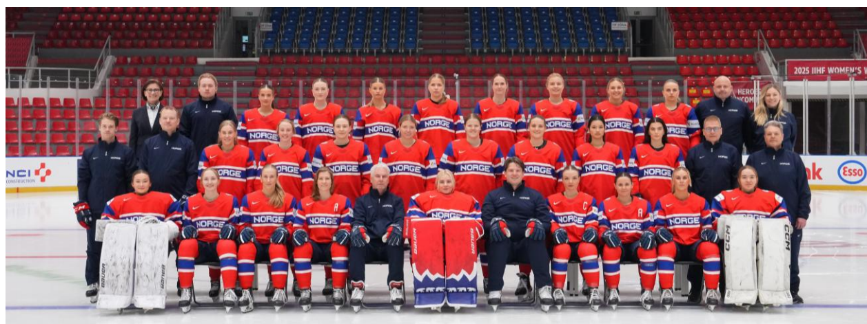
Lagbilde VM 2026.